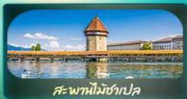
สะพานไมซ์าเปลา