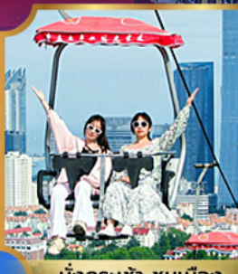
นั่งกระเช้า ชมเมือง