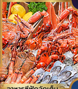
อาหารซีฟู้ดจัดเต็ม

บุฟเฟต์เบียร์ไม่อั้น + ซีฟู้ด + บิงย่างเกาหลี