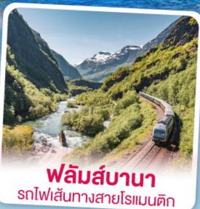
พลิမ်ส์บานา รถไฟเส้นทางสายโรแมนติก