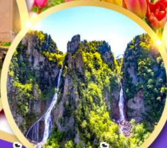
น้ำตกกิ่งกะ-น้ำตกริวเซ