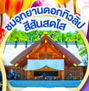
ชมอุทยานดอกทิวลิป สีแสนสดใส