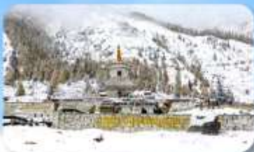
อุทยานกูเวาสีครุณี