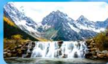
อุทยานปี้ผิงโกว