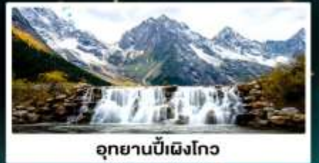
อุทยานปี้เฉิงโกว