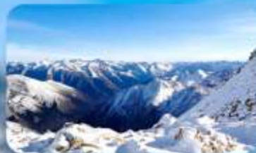
อุทยานคำกู่ปิงชว่น