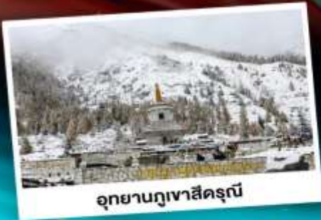
อุทยานกู๋เจาสีดรุณี