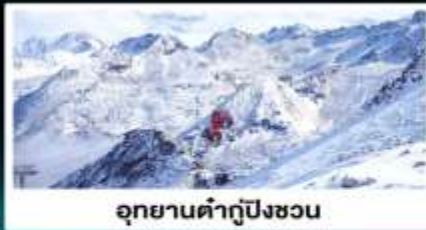
อุทยานคำกู่ปิงซอน