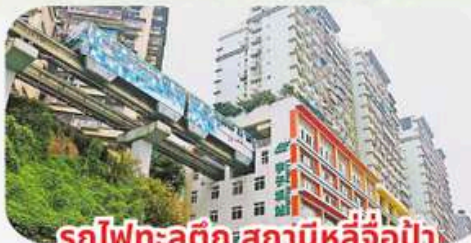
รถไฟฟ้าสถานีหลี่จ้อปา