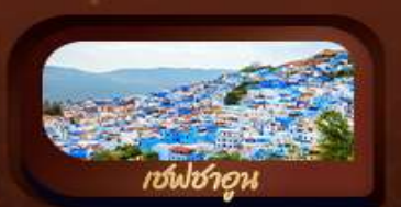
เชฟชาอูน