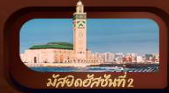
มัสยิดฮัสซันที่ 2