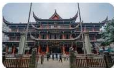
วัดเหวินซู