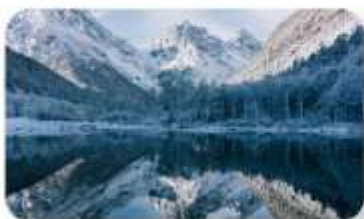
ปี้ฝิงโกว