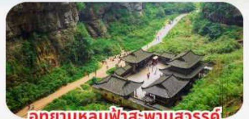
อุทยานหลุมฟ้าสะพานสวรรค์