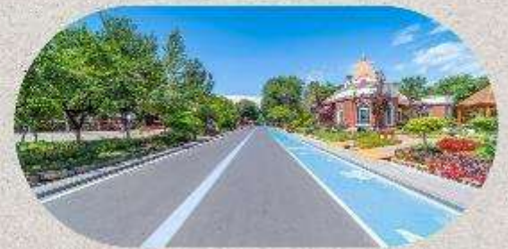
หมู่บ้านโบราณอุยกูร์คางันจิ