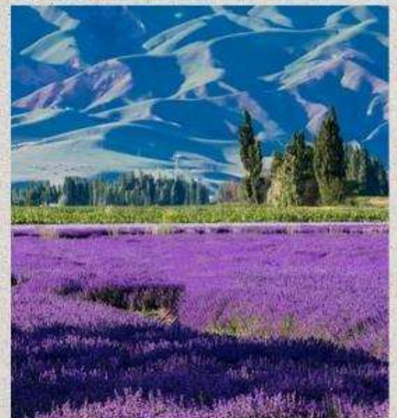
สวนดอกไม้้อลีเทียนซาน