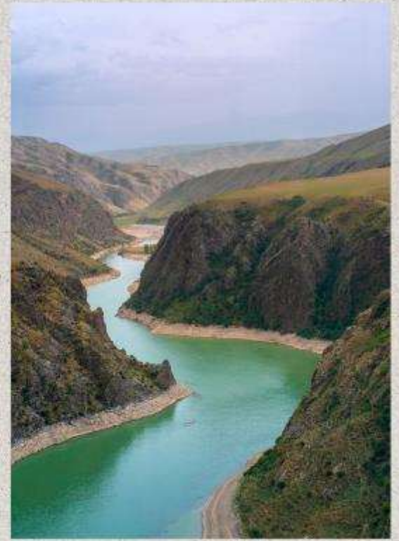
แกรนด์แคนยอนคูโคซุ