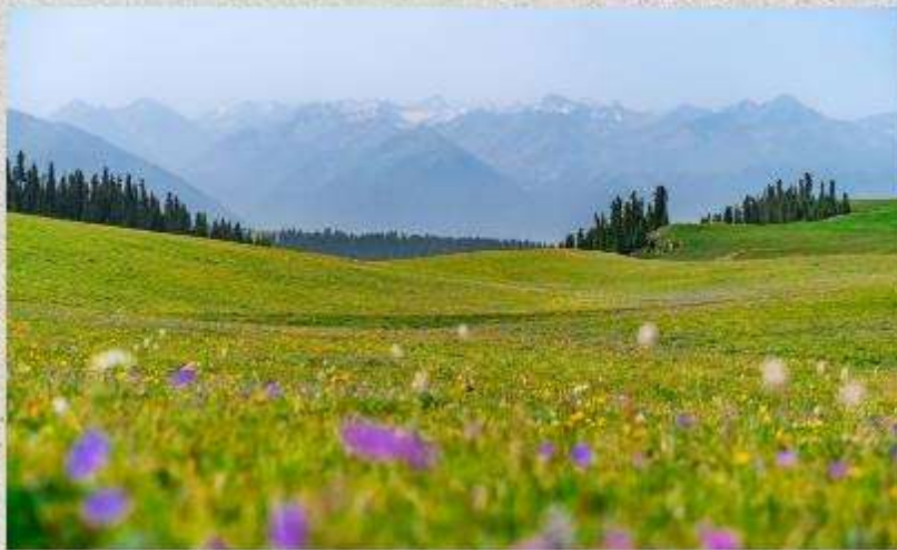
ทุ่งหญ้าคารา