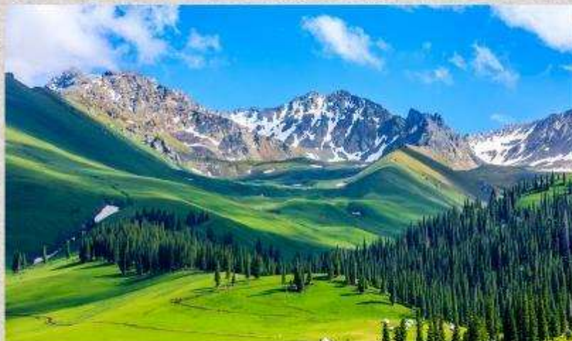
ทุ่งหญ้านาลากี