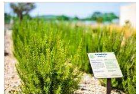
The Mediterranean Garden