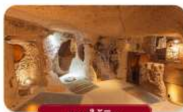
นครใต้ดิน