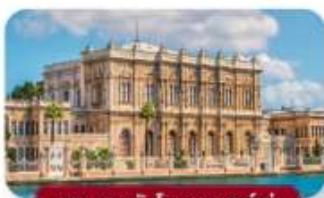
พระราชวังโดลมาบาห์เซ่