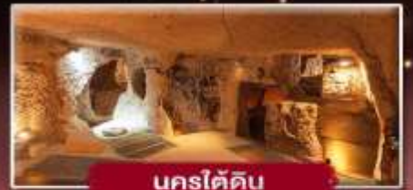
นครใต้ดิน