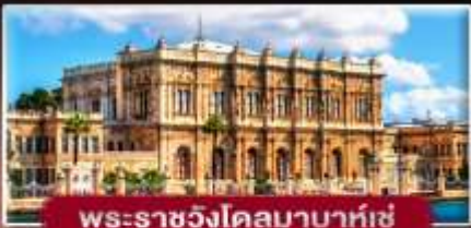
พระราชวังโดลมาบาห์เซ่