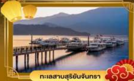
ทะเลสาบสุริยอินจันตรา