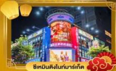
ซีเทมินคิงโถกมาร์เก็ต