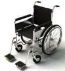
การรับรถดูแลเป็นพิเศษ

กรณีผู้เดินทางต้องการความช่วยเหลือเป็นพิเศษ อาทิเช่น การใช้วีลแชร์ กรุณาแจ้งบริษัทฯ อย่างน้อย 7 วันก่อนการเดินทาง มิฉะนั้นบริษัทฯ จะไม่สามารถจัดการล่วงหน้าได้ เนื่องจากการขอใช้วีลแชร์ในสนามบินนั้น ต้องมีขั้นตอนในการขอล่วงหน้า และบางสายการบินอาจมีการเรียกเก็บค่าใช้จ่ายทั้งทางสนามบินไทยและในต่างประเทศ ซึ่งผู้เดินทางสามารถสอบถามกับเจ้าหน้าที่ได้โดยตรงก่อนทำการจอง และหากในขณะของท่านมีผู้ต้องการดูแลพิเศษ เช่น ผู้ที่นั่งรถเข็น (Wheelchair), เด็ก, ผู้สูงอายุและผู้ที่มีโรคประจำตัวหรือไม่สะดวกในการเดินทางท่องเที่ยวในระยะเวลาเกินกว่า 4 - 5 ชั่วโมงติดต่อกัน ท่านและครอบครัวต้องให้การดูแลสมาชิกภายในครอบครัวของท่านเอง เนื่องจากการเดินทางเป็นหมู่คณะ หัวหน้าทัวร์มีความจำเป็นต้องดูแลคณะทัวร์ทั้งหมด