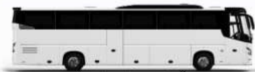
ตัวอย่างรูปภาพรถ 1 ชั้น