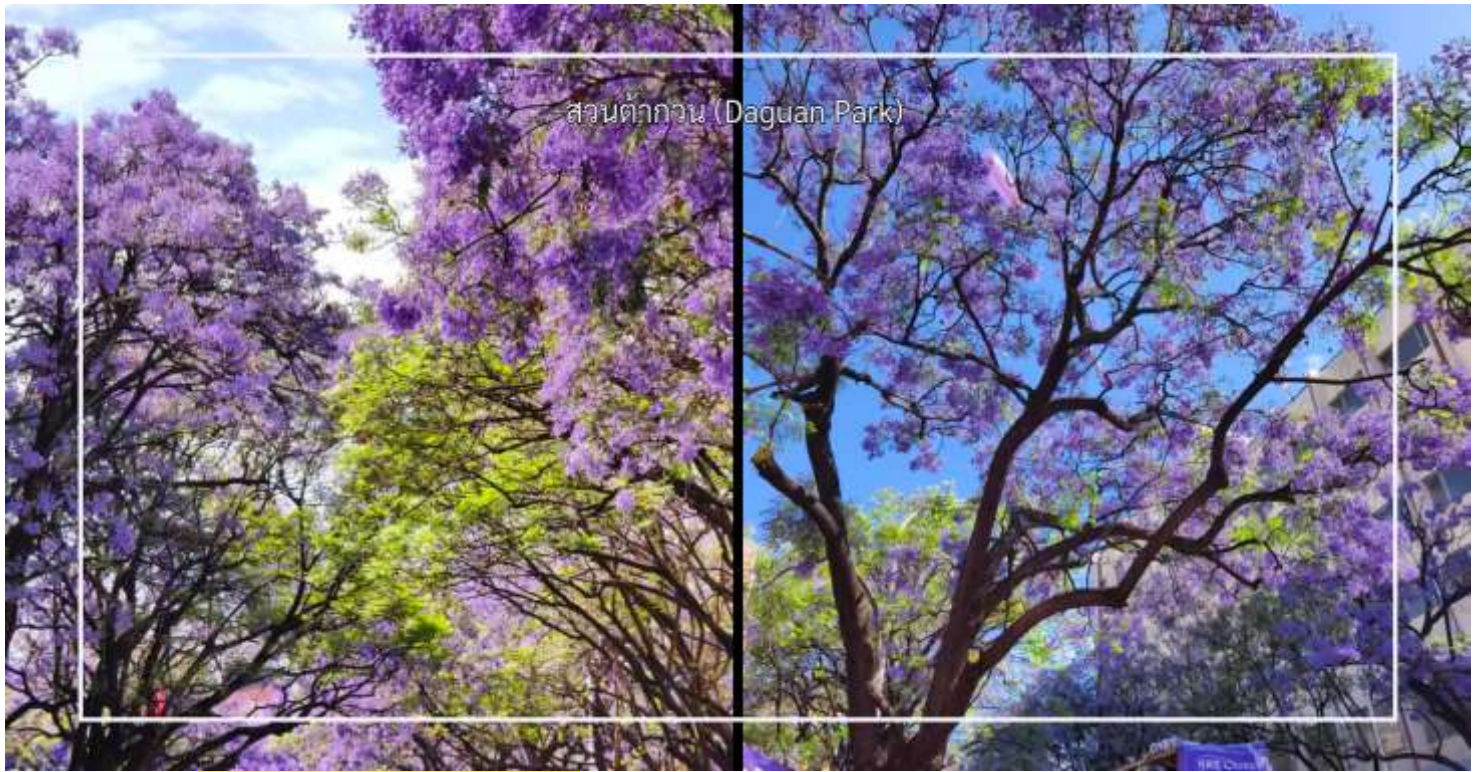
สวนต้ากวน (Daguan Park)