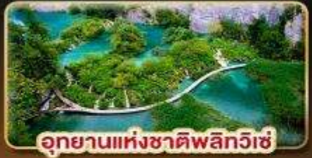
อุทยานแห่งชาติพลิตวิเช่