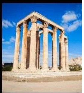
Temple Of Olympian