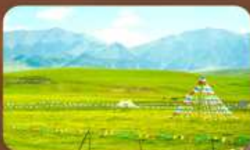
ทุ่งหญ้าออร์คอส