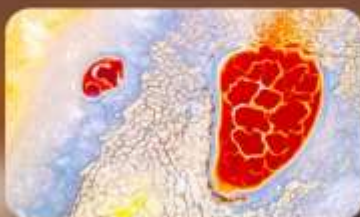
ทะเลสาบอูลาน