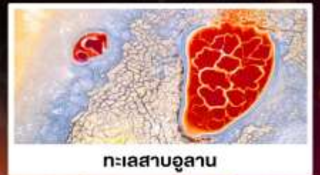
ทะเลสาบอูลาน