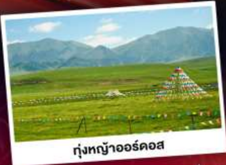
ทุ่งหญ้าออร์ดอส