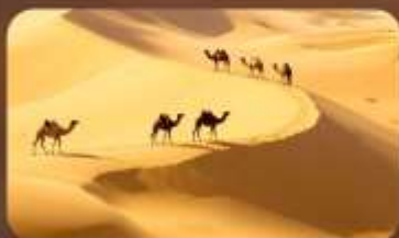
เนินทรายเสียงชวาน