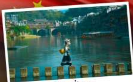
หมู่บ้านเฟิ่งทง

สุดคุ้ม!! พัก 5 ดาว ทุกคืน มนตร์เสน่ห์เมืองเก่า ริมสายน้ำแห่งขุนเขา