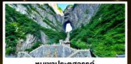
หุบเขาประตูสวรรค์