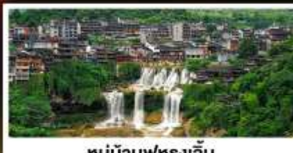
หมู่บ้านฟุทงเจิน