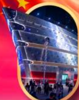
เรือเดอะหลุยส์