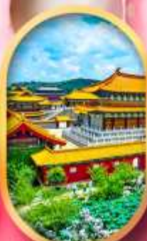
เมืองจำลองสามก๊ก