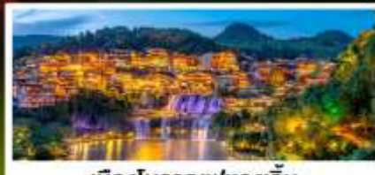
เมืองโบราณฟุทงเจิ้น