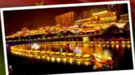
เมืองโบราณเซียนเิน

เที่ยว 2 เมือง จางเจี๋ยเจีย & เอนซือ ล่องเรือแคนยอนผิงซาน เที่ยวหุบเขาอวตาร