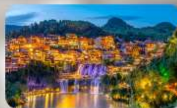
เมืองโบราณฟุทงเจิ้น