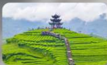
กูเขาไร่ซาอูโตเจีย