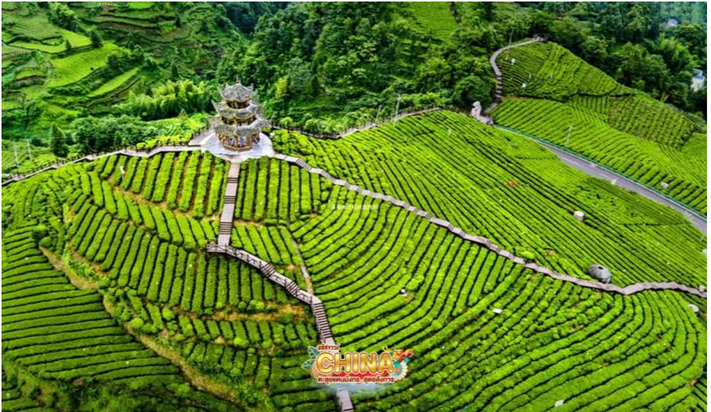
(หมายเหตุ: ทิวทัศน์ขึ้นอยู่กับสภาพปลูก)

เดินทางสู่ เมืองโบราณเซียนอิน ชมความงามตระการตาของแสงสียามค่ำคืนของเมืองโบราณแห่งนี้ที่มีแม่น้ำก่งสุ่ยไหลผ่านใจกลางเมือง ถ่ายรูปกับสะพานโบราณที่เปิดไฟประดับสวยงามในตอนกลางคืน เพลิดเพลินไปกับน้ำพุดนตรีริมสะพานเหวินหลาน และลิ้มลองเมนูปลาย่างสดๆ แสนอร่อยที่มีขายอยู่มากมาย