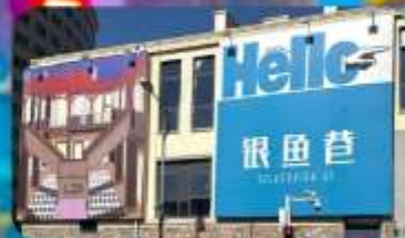
ตรอกซิลเวอร์ฟิช