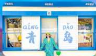
ถนนหลงเจียง