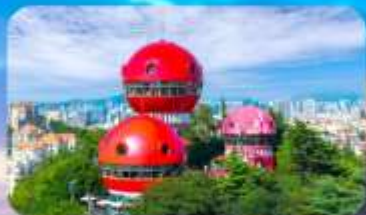
จุดชมวิว SIGNAL HILL