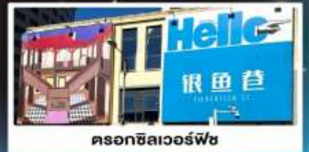
ดรอกซิลเวอร์ฟิช