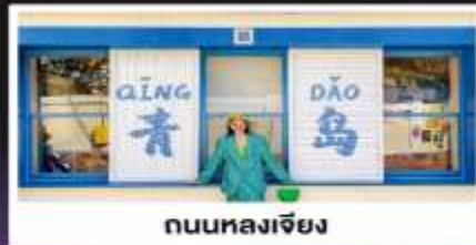
ถนนหลงเจียง