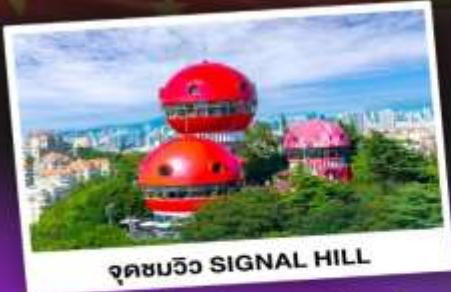
จุดชมวิว SIGNAL HILL