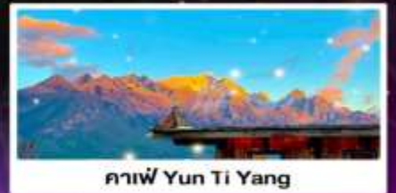
คาเฟ่ Yun Ti Yang