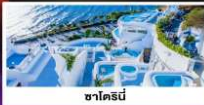
ซาโตรนี่