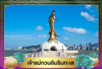
เจ้าแม่ทวนอิมริมทะเล