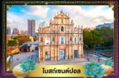
โบสถ์เซนต์โดม