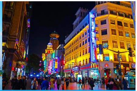
ถนนคนเดินหนานจิงลุ่

หลังอาหารนำท่านเดินทางสู่ นครเซี่ยงไฮ้ 上海 (ระยะทาง 210 กม. ใช้เวลาเดินทางราว 3 ชั่วโมง)