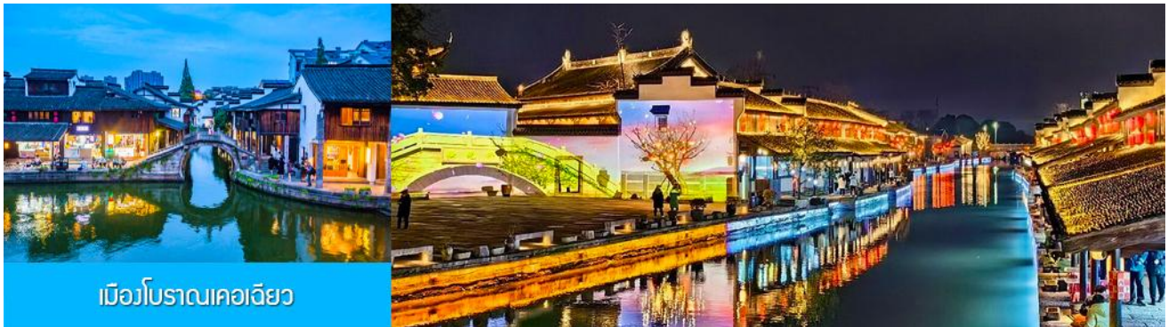
เมืองโบราณเคอเจียว