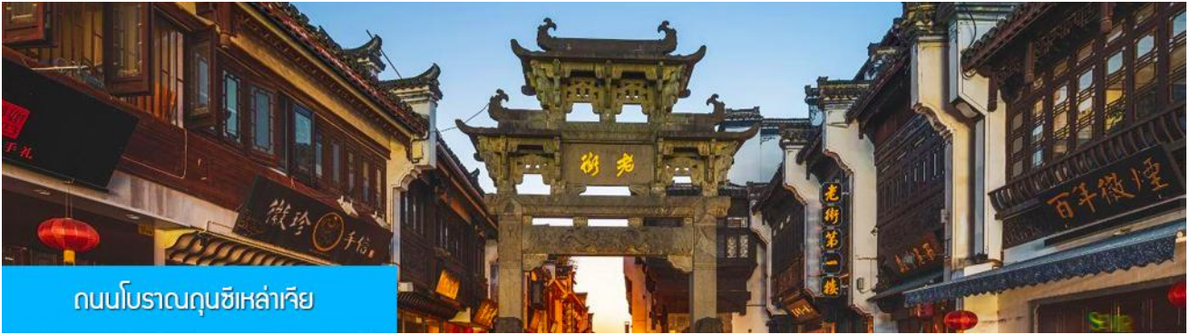
ถนนโบราณถนนซีเหล้าเจีย

นำท่านเที่ยวชม ถนนโบราณถนนซีเหล้าเจีย 屯溪老街 ถนนที่เป็นย่านการค้าโบราณในยุคราชวงศ์ซ่งอายุกว่าพันปี ถนนมีความยาวราว 980 เมตร สองฝั่งถนนมีอาคารบ้านเรือนโบราณสไตล์ฮุ่ยโจว ยุคปลายราชวงศ์หมิง และราวส์ซิงที่ถูกอนุรักษ์ไว้เป็นอย่างดี ปัจจุบันยังมีห้างร้าน โบราณ อาทิ ร้านขายโบราณวัตถุ ร้านขายหยก ร้านขายภาพเขียนและอักษรพู่กัน โบราณ ร้านอาหารพื้นเมือง ร้านขายของที่ระลึก ฯลฯ นอกจากนี้ร้านค้าและอาคารบ้านเรือน โบราณที่นี้ยังเป็นแหล่งรวมของนักท่องเที่ยวที่มาชิมอาหารพื้นเมือง เดินช้อปปิ้ง และถ่ายภาพเช็คอิน