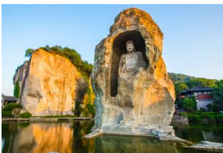
อุทยานเคอเหยียน

พักที่ โรงแรม KAIYUAN MINGTING HOTEL 4* หรือเทียบเท่าในเมืองเส้าชิง