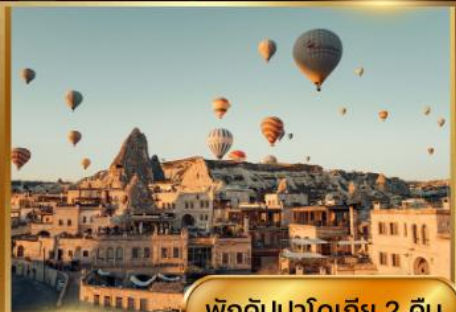
พิกคิปปาโดเกีย 2 คืน