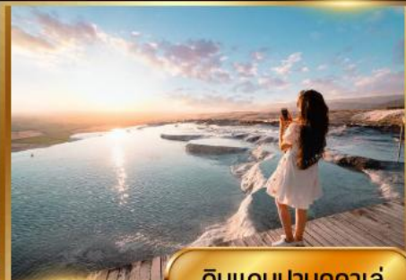
ดินแดนปามุคคาเล่