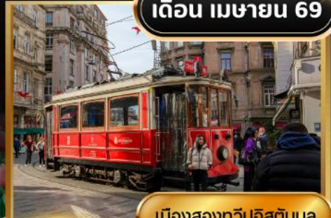
เมืองสองทวีปอิสตันบูล