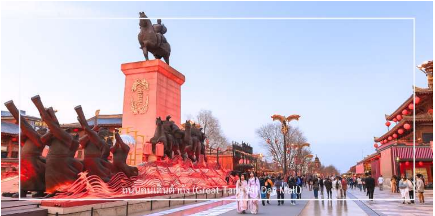
ถนนคนเดินต้าถั่ง (Great Tang All Day Mall)

ถนนคนเดินต้าถั่ง (Great Tang All Day Mall) อีกหนึ่งแลนด์มาร์คสุดฮิตของเมืองซีอาน ตั้งอยู่ใกล้กับเจดีย์ห่านป่าใหญ่ อลังการด้วยการออกแบบที่จำลองบรรยากาศความรุ่งเรืองในยุคราชวงศ์ถัง สองฟากถนนเรียงรายด้วยอาคารสไตล์จีนประยุกต์ ผสมผสานกลิ่นอายโบราณเข้ากับความร่วมมือได้อย่างลงตัว เต็มอิมกับการเลือกชมและเลือกซื้อสินค้าในร้านค้าของที่ระลึก คาเฟ่ ร้านอาหาร และเครื่องดื่มชื่อดัง พร้อมชม การแสดงศิลปะพื้นบ้านกลางแจ้ง ไม่ว่าจะเป็นดนตรีสด การแสดงหุ่นเงา การรำโบราณ รวมถึงการแสดงแสง สี เสียง ตามจุดต่าง ๆ ตลอดแนวถนน พร้อมชมความงดงามของบรรยากาศที่เต็มไปด้วยแสงสีของดวงไฟที่สาดส่องสว่างไสวอย่างสวยงาม