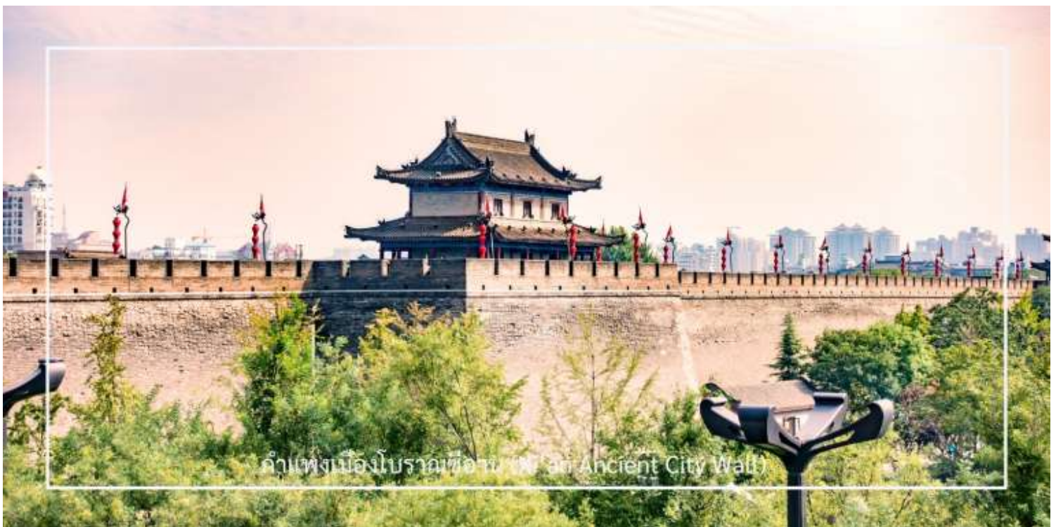
กำแพงเมืองโบราณซีอาน (Xi'an Ancient City Wall)

รับประทานอาหารเที่ยง ณ ภัตตาคาร (มื้อที่ 6) เมนูพิเศษ : สุกี้