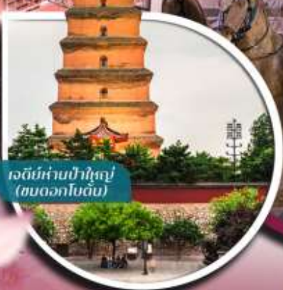
เจดีย์ห้าชั้นปาใหญ่ (ชมดอกไม้ไซดัม)