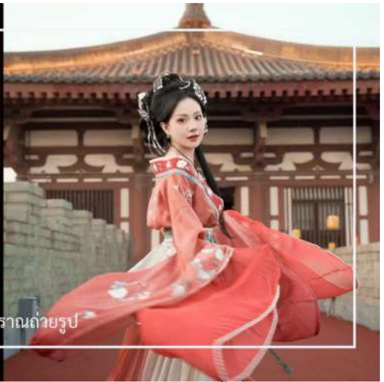
ใส่ชุดจีนโบราณถ่ายรูป

ถนนคนเดินต้าถั่ง (Great Tang All Day Mall) อีกหนึ่งแลนด์มาร์คสุดฮิตของเมืองซีอาน ตั้งอยู่ใกล้กับเจดีย์ห่านป่าใหญ่ อลังการด้วยการออกแบบที่จำลองบรรยากาศความรุ่งเรืองในยุคราชวงศ์ถัง สองฟากถนนเรียงรายด้วยอาคารสไตล์จีนประยุกต์ ผสมผสานกลิ่นอายโบราณเข้ากับความร่วมมือได้อย่างลงตัว เต็มอิมกับการเลือกชมและเลือกซื้อสินค้าในร้านค้าของที่ระลึก คาเฟ่ ร้านอาหาร และเครื่องดื่มชื่อดัง พร้อมชม การแสดงศิลปะพื้นบ้านกลางแจ้ง ไม่ว่าจะเป็นดนตรีสด การแสดงหุ่นเงา การรำโบราณ รวมถึงการแสดงแสง สี เสียง ตามจุดต่าง ๆ ตลอดแนวถนน พร้อมชมความงดงามของบรรยากาศที่เต็มไปด้วยแสงสีของดวงไฟที่สาดส่องสว่างไสวอย่างสวยงาม