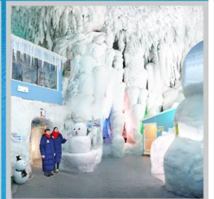
"KAMIKAWA ICE PAVILLION"