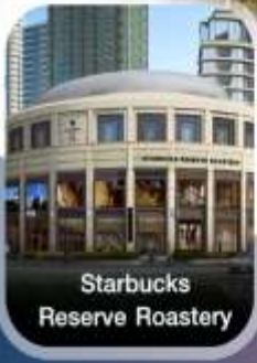
Starbucks Reserve Roastery

เทศกาล สงกรานต์ คอนเฟิร์มออกเดินทาง ทุกพีเรียด 2 ท่านขึ้นไป