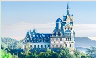
ปราสาทตามด้าว