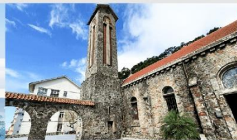
โบสถ์หินตามด้าว