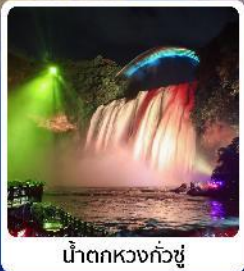
น้ำตกหวงกั๋วซู่