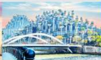
อาคารฟันทันโม