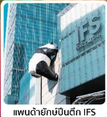
แพนด้ายักษ์ปิ่นตึก IFS