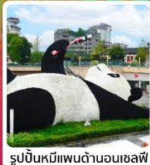
รูปปั้นหมีแพนด้าอนุเชลฟี