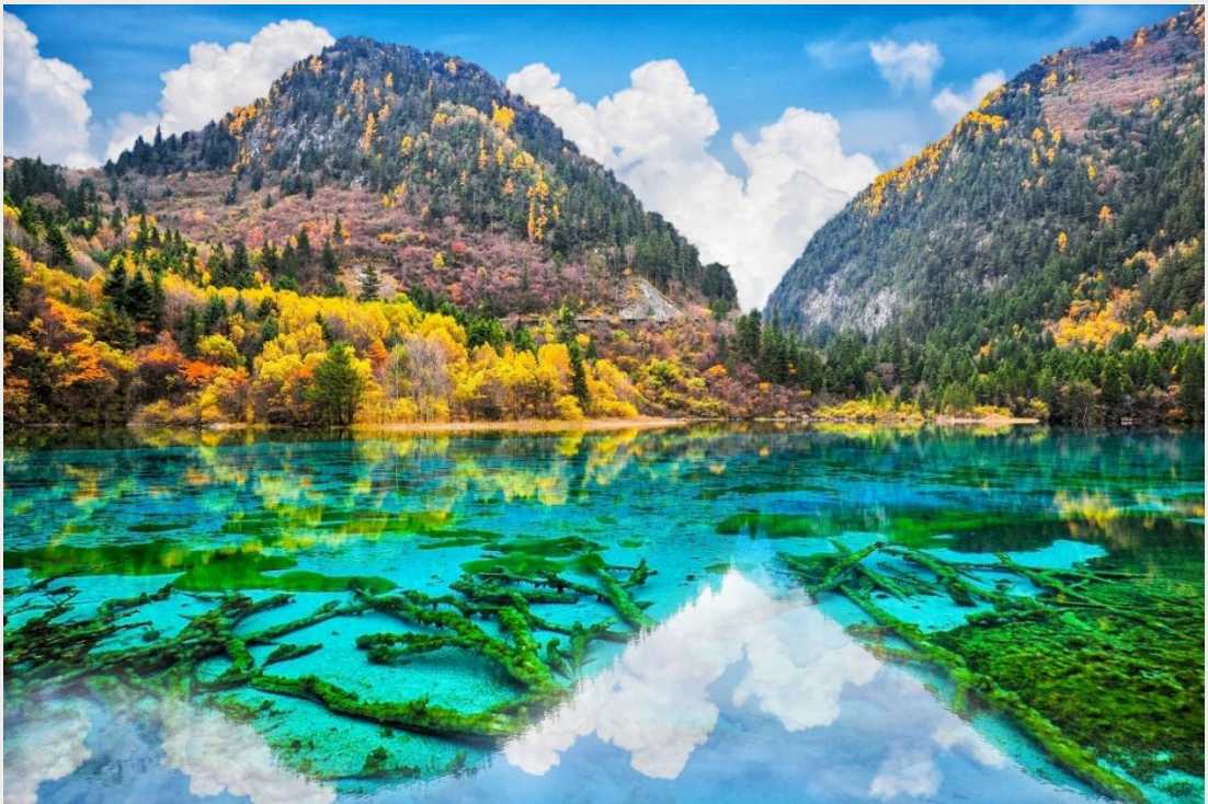
ฤดูใบไม้ร่วง (AUTUMN)