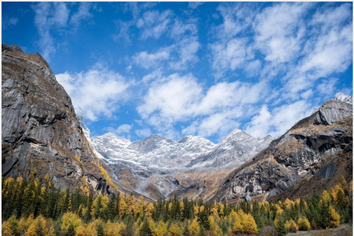
ฤดูใบไม้ร่วง (AUTUMN)