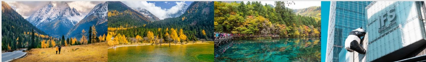
ภูเขาสี่ดรุณี (หุบเขาชวงเจียวโกว)