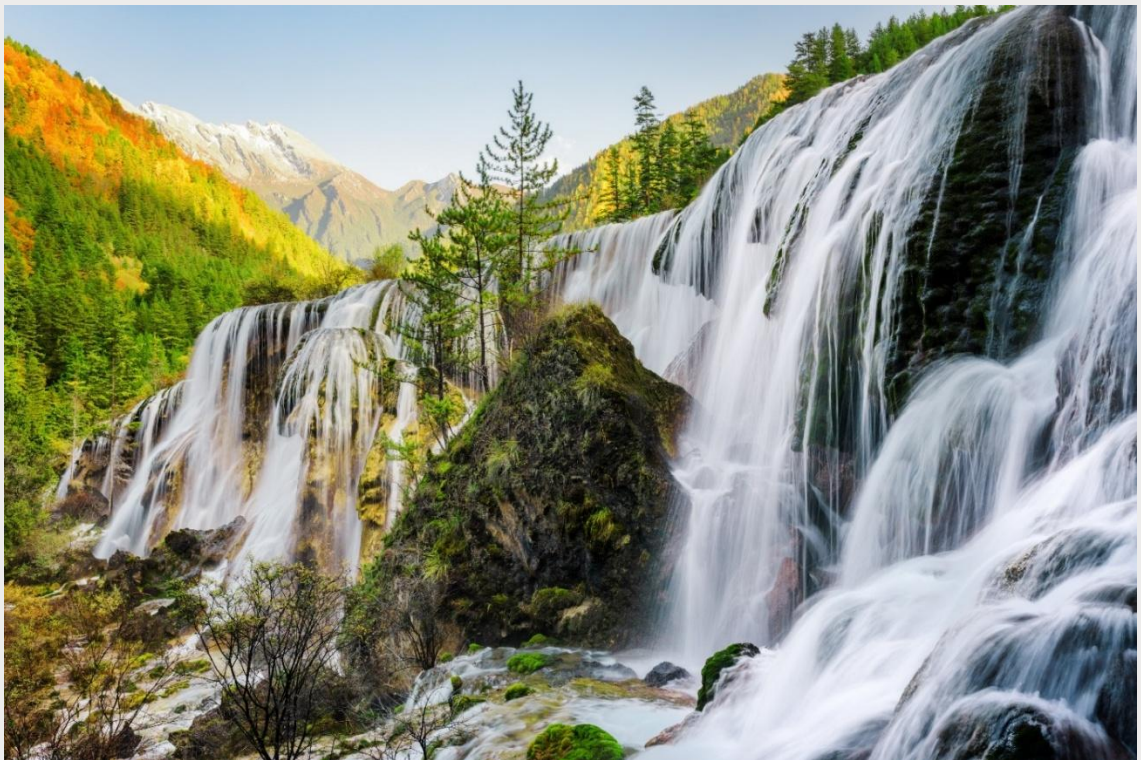
ฤดูใบไม้ร่วง (AUTUMN)