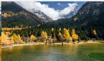
อุทยานแห่งชาติปี้เฟิงโกว