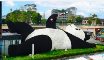
รูปปั้นหมีแพนด้าอนเซลฟี่

*ทางบริษัทฯ ขอสงวนสิทธิ์ในการสลับโปรแกรมทัวร์ตามความเหมาะสมขึ้นอยู่กับสถานการณ์หน้างาน โดยคำนึงถึงผลประโยชน์ของลูกค้าเป็นสำคัญ