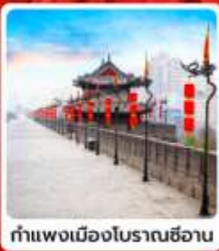
กำแพงเมืองโบราณซีอาน