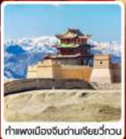
กำแพงเมืองจีนด่านเสี่ยววี่กวน

• ไซโล่...เส้นทางสายไหม ชมสระน้ำวังพระจันทร์ ทะเลทรายหมีงาช้าง กำแพงเมืองจีนด่านสุดท้าย "เจียยวี่กวน" มรดกโลกภูเขาสายรุ้งจางเย่