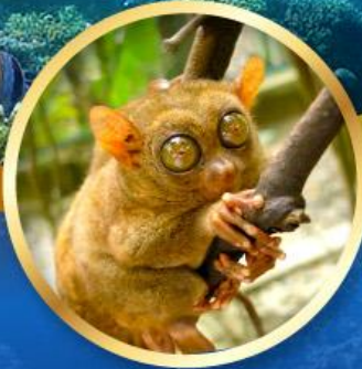
ลิงทาร์เซีย