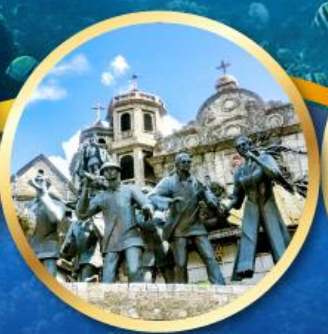
อนุสาวรีย์มรดกแห่งเซบู