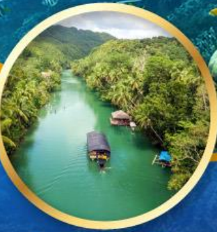
ล่องเรือแม่น้ำไลบ็อก