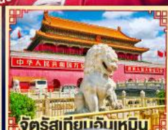
จัตุรัสเทียนจันเหมิน