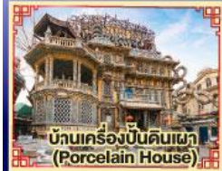
บ้านเครื่องปั้นดินเผา (Porcelain House)