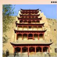
ตำม่อเถา

17-24 ส.ค. 69 32,900 24-31 ส.ค. 69 32,900 31 ส.ค.-07 ก.ย. 69 33,900 14-21 ก.ย. 69 31,900 12-19 ต.ค. 69 32,900