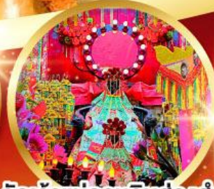
วัดเจ้าแม่กวนอิมฮ้องฮำ