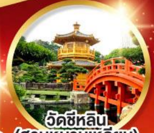
วัดซีหลิน (สวนหนานเหลียน)