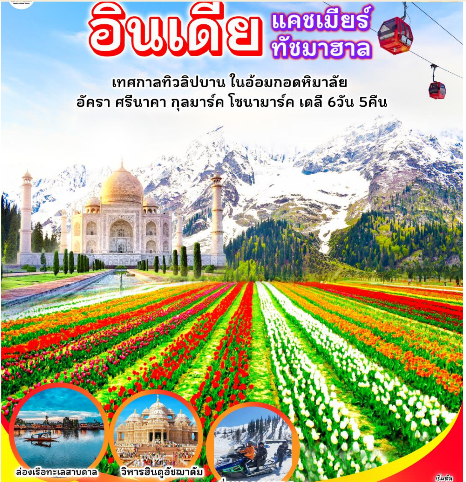
ล่องเรือทะเลสาบตาเล

เทศกาลทิวลิปบาน ในอ้อมกอดหิมาล้ำ อัครา ศรีนาคา กุลมาร์ค โซนามาร์ค เดลี 6วัน 5คืน