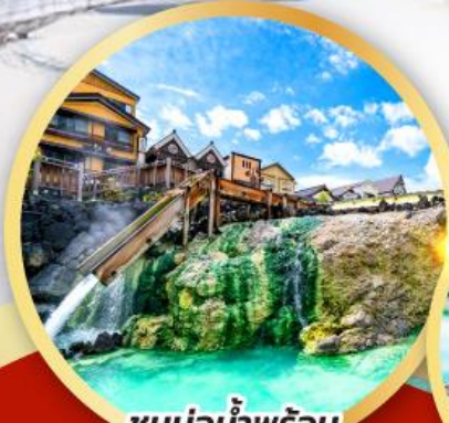
ชมบ่อน้ำพุร้อน ยูบาคาเกะ