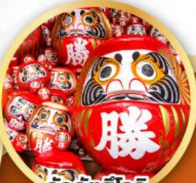
วัดคัตสึโองิ (วัดदारุมะ)

ชมความงามของกำแพงหิมะ เส้นทางสายอัลไพน์ ทากายามา (JAPAN ALPS SNOW WALL)