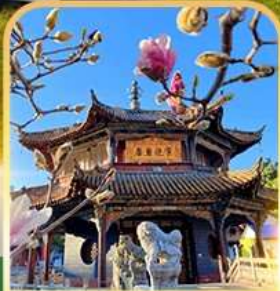
วัดหยวนตง