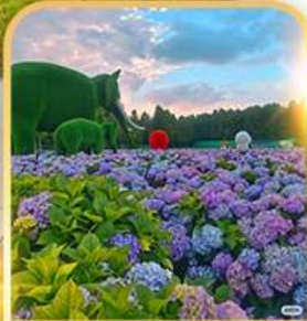
ดอกไม้ตามฤดูกาล