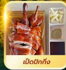
เปิดปอกกิ้ง