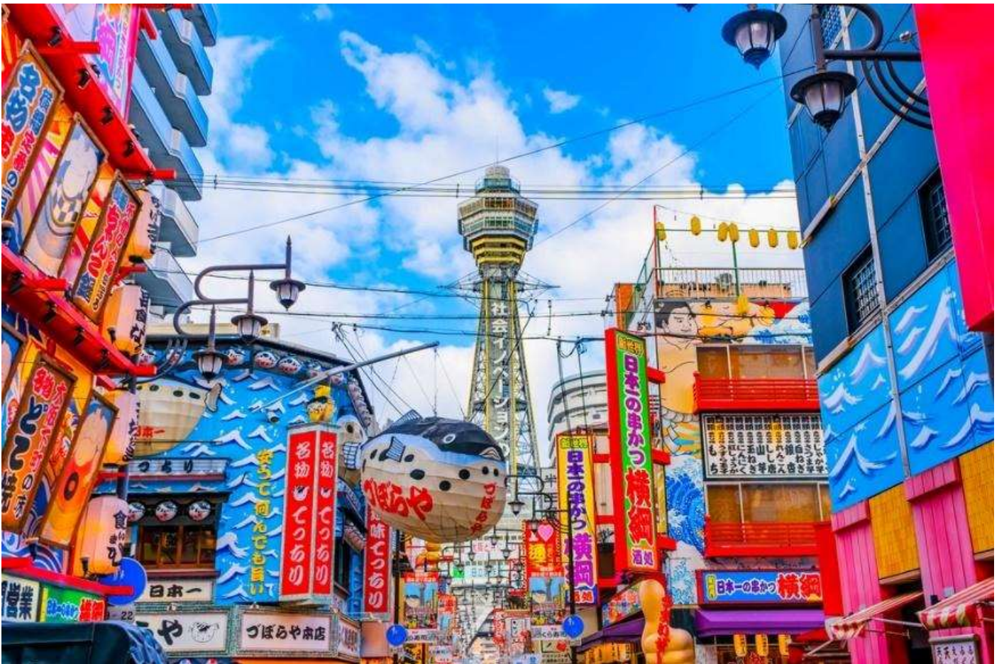
ค้า อีสรอาหาร ตามอัยาศัยเพื่อสะดวงแก้การท่องเที่ยว

จากนั้นนำท่านเดินทางสู่ ย่านชินเซไก (OSAKA SHIN SEKAI) ย่านใจกลางเมืองทางตอนใต้ของเมืองโอซาก้าที่มีชื่อเสียงด้านหอคอยซีเท็นคาคุ จันจัน โยโกโซ และป้ายโคมไฟปลาปักเป้าขนาดใหญ่ มีร้านค้าประมาณ 50 ร้าน รวมถึงร้านอาหารคุซึคัตสึ ร้านอาหารโตเตยากิ และคลับโกและโซกิ ในวันเสาร์ วันอาทิตย์ และวันหยุดนักขัตฤกษ์ นักท่องเที่ยวจำนวนมากจะมาเยี่ยมชมและเพลิดเพลินกับการถ่ายภาพที่ระลึกโดยมีบิลลิเกนและป้ายโคมไฟปลาปักเป้าเป็นฉากหลัง