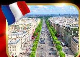
เดินเล่นย่านช็องเซลีซ