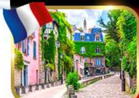
Rue de l'Abreuvoir มงมาร์ต