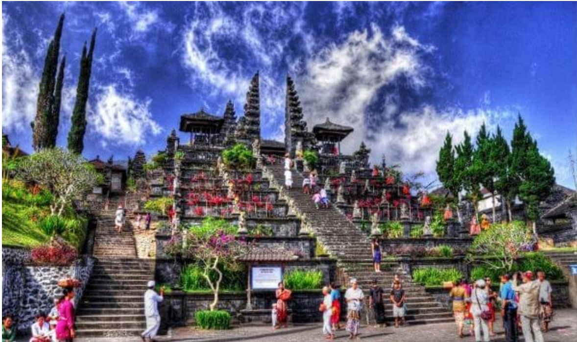
*** หากมีการแจ้งเตือนภัยภูเขาไฟ ขอสงวนสิทธิ์ในการปรับไปชมวัดบาตอร์แทน ***

จากนั้นเดินทางขึ้นสู่ เทือกเขา Kintamani เป็นพื้นที่ท่องเที่ยวชื่อดังทางตอนเหนือของเกาะบาหลี่ ประเทศอินโดนีเซีย โดดเด่นด้วยทิวทัศน์ธรรมชาติอันงดงามของ ภูเขาไฟบาตอร์ (Mount Batur) ที่ยังคงมีพลัง พร้อมกับทะเลสาบบาตอร์ (Lake Batur) ซึ่งเป็นทะเลสาบน้ำจืดขนาดใหญ่ ตั้งอยู่ท่ามกลางหุบเขาและภูเขาสูง บรรยากาศเย็นสบายตลอดปี เหมาะแก่การพักผ่อนและชมวิถีแบบพาโนรามา พื้นที่คันทันยังเป็นแหล่งเพาะปลูกกาแฟที่มีชื่อเสียง โดยเฉพาะ กาแฟขี้ชะมด (Kopi Luwak) กาแฟขึ้นชื่อระดับโลก นักท่องเที่ยวสามารถเยี่ยมชมสวนกาแฟ เรียนรู้ขั้นตอนการผลิต ตั้งแต่การปลูก การคัดเลือกเมล็ด ไปจนถึงการชิมกาแฟสด ๆ พร้อมชมวิถีภูเขาไฟและทะเลสาบที่สวยงาม เป็นประสบการณ์ที่ผสมผสานทั้งธรรมชาติ วัฒนธรรม และวิถีชีวิตท้องถิ่นได้อย่างลงตัว