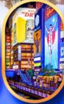
ย่านชิบโฮบาชิ